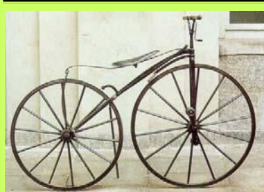
Arte e biciclette